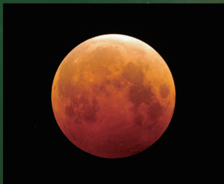
西はりま天文台で撮影された月食画像